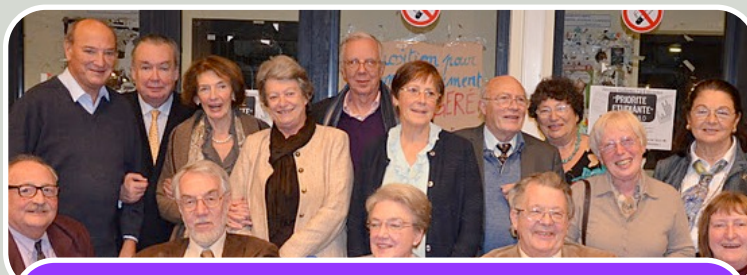
Banquet A.Sc.Br.: La promotion 1961 était au rendez-vous!

Le banquet de l'A.Sc.Br. s'est déroulé le 25 novembre, mettant à l'honneur les promotions 1961, 1986 et 2011. Toutes les générations ont pu se rencontrer à l'occasion de ce banquet, pour le plus grand bonheur de tous.