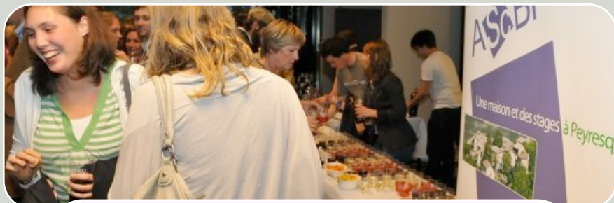
Proclamations 2011 : Drink post-cérémonie

Pour terminer, l'ensemble du CA de l' A.Sc.Br. vous remercie chaleureusement , vous, les membres de l'A.Sc.Br., car ce sont vos cotisations qui permettent l'organisation de toutes ces activités, qui permettent un soutien aux Sciences, aux jeunes diplômés de la Faculté, dans le respect des valeurs qui nous sont chères !