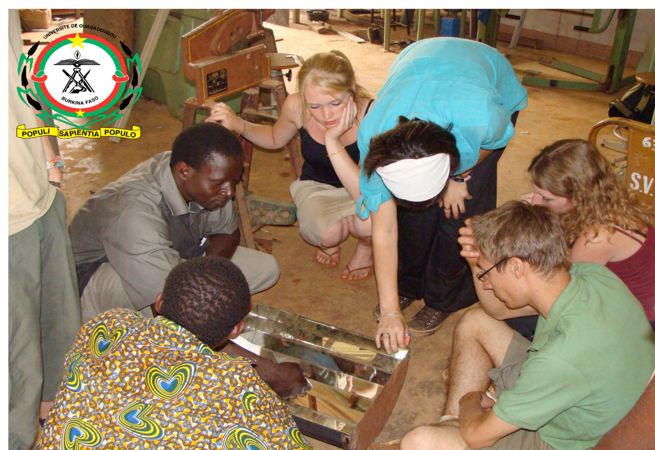
Production d'huiles essentielles au Burkina-Faso