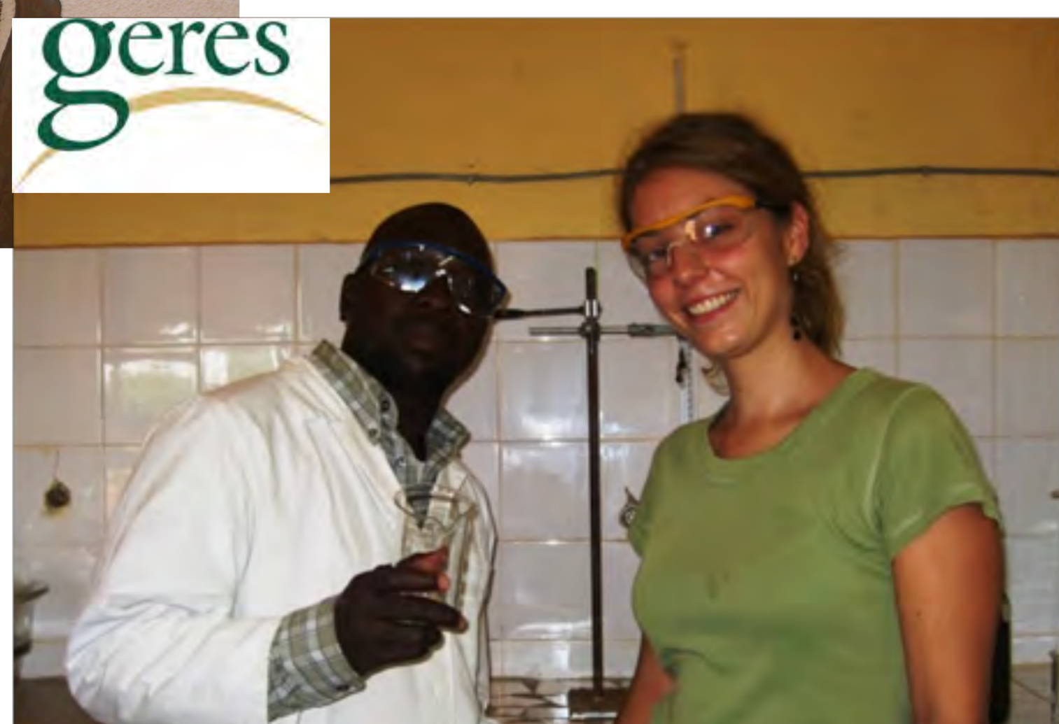
Etude d'agro carburants au Mali