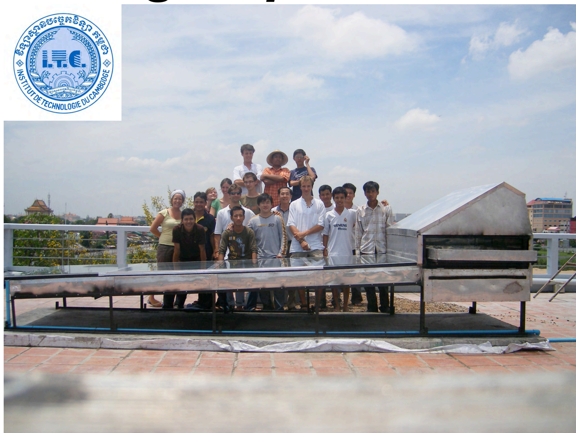
Séchage de riz au Cambodge