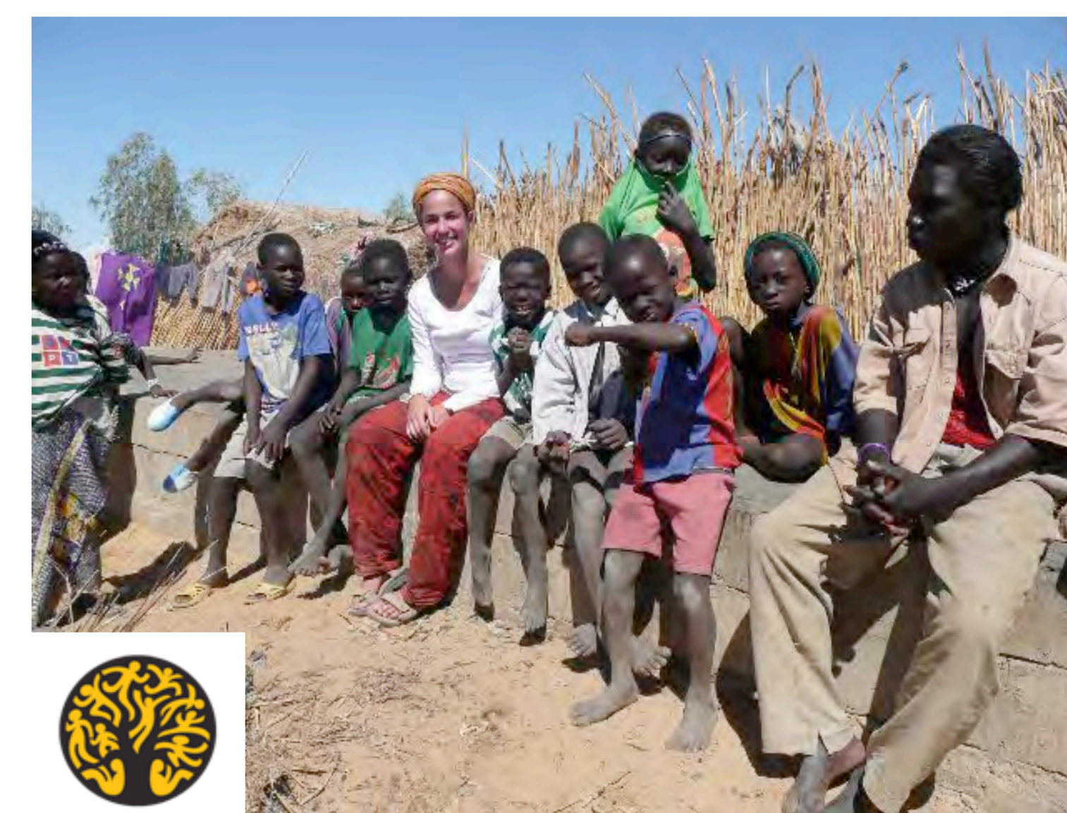
Séchage de poissons au Mali