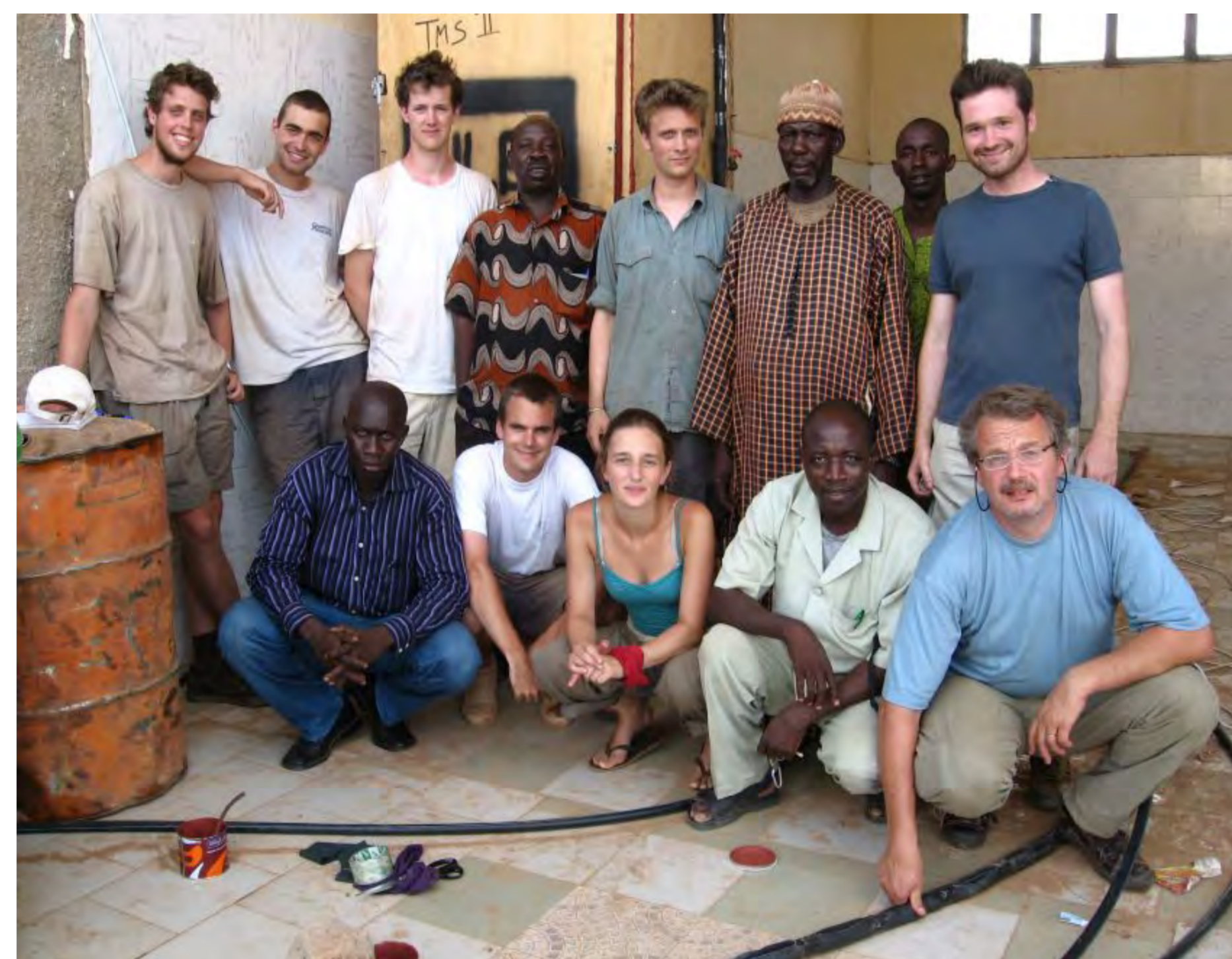
Séchage de tomates au Mali