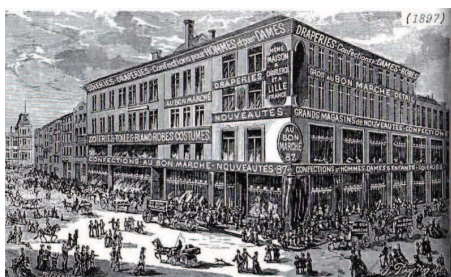
Source : DUBREUCQ J. (1999), Bruxelles 1000 Une histoire Capitale, Vol.6, Bruxelles