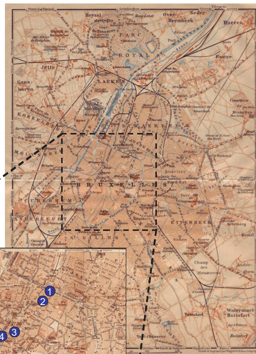
Guide Baedeker (1910)