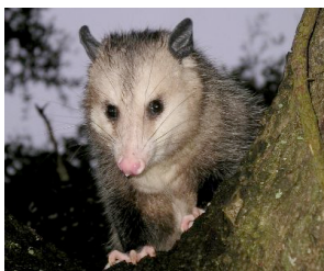
L'opossum ( Didelphis marsupialis )