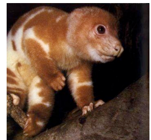
Le cuscous tacheté ( Spilocuscus maculatus )

- Disparition des marsupiaux là où trop forte concurrence avec les placentaires SAUF en Australie