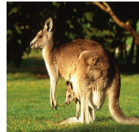
Le kangourou roux ( Macropus rufus )