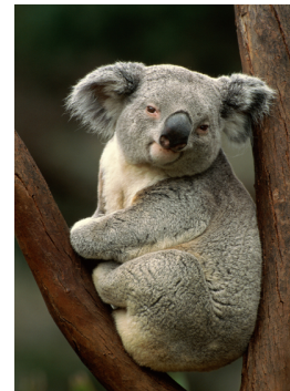
Le koala ( Phascolarctos cinereus )