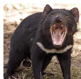
Le diable de Tasmanie ( Sarcophilus harrisii )