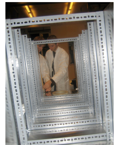
Conception d'un prototype