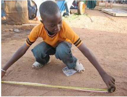
Un travail de précision