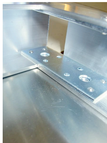
Conception d'un prototype