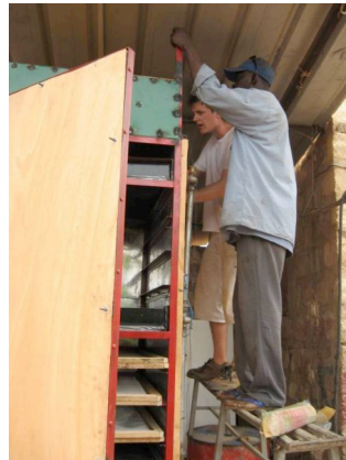
Finalisation de l'unité centrale