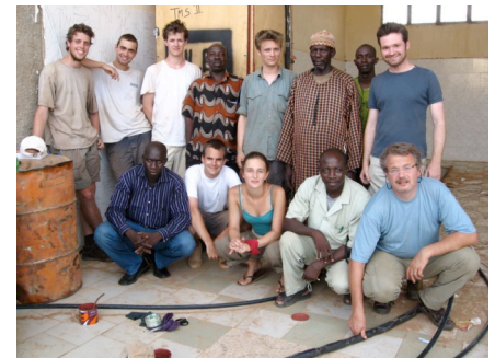
Le groupe d'étudiant au complet