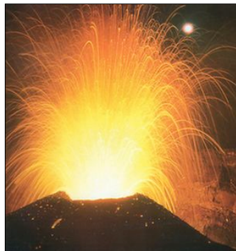
Le Saint Helens, Etats-Unis