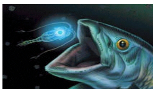
La méduse Atolla

En propageant des ondes lumineuses le long de leur corps, celui-ci paraît plus gros, ce qui dissuade ses prédateurs.