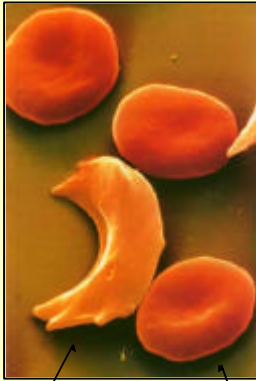
Globule rouge anormal Globule rouge normal

La drépanocytose, ou anémie falciforme, est une maladie génétique, héréditaire et récessive due à la présence de globules rouges anormaux dans le sang.