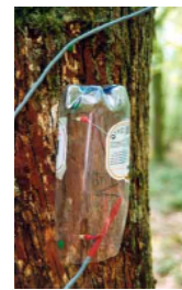
Protection du dispositif contre la pluie