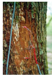
Les deux thermocouples insérés dans l'aubier

Seule la conduction est prise en considération les autres étant considérés comme négligeables. Le coefficient de transfert de chaleur dépend du flux de sève.