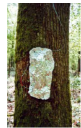
Protection contre le rayonnement solaire