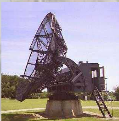
Système de mesure