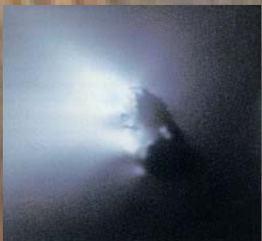
Comète de Halley photographiée par la sonde spatiale Giotto de l'ESA en 1986