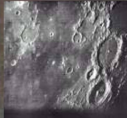
Ranger 7 a pris la première photographie de la Lune le 31 juillet 1964