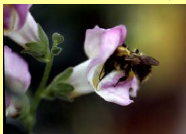
Bourdon sur muflier