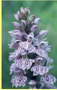
Orchidée Symétrie bilatéral

→ attire toutes sortes d'insectes peu spécialisés