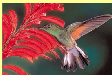
Colibri sur fleur rouge