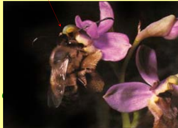
hyménoptères + Ophrys Abeille