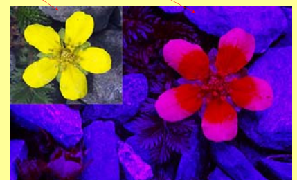
Potentille des oies