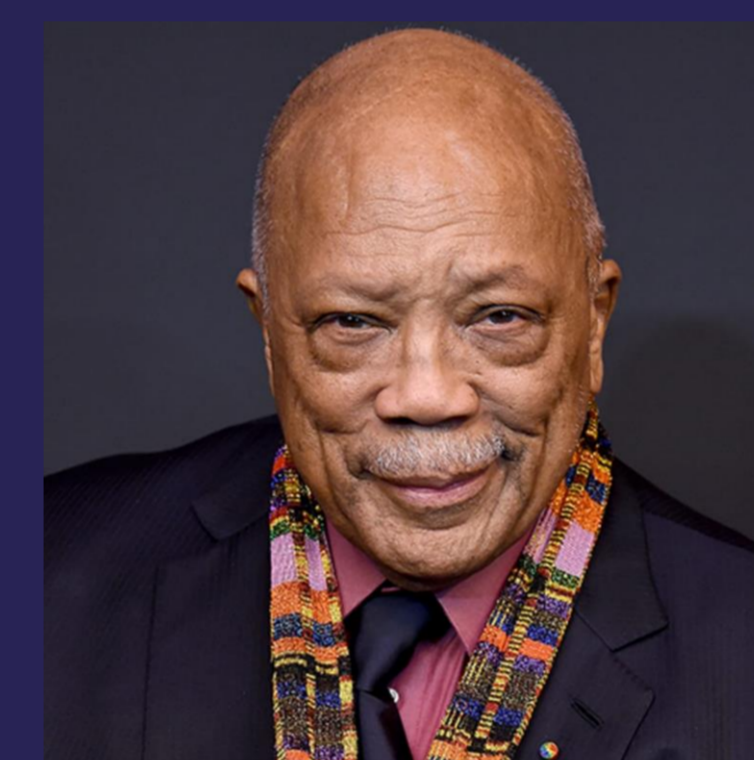
QUINCY JONES Trompette - 280