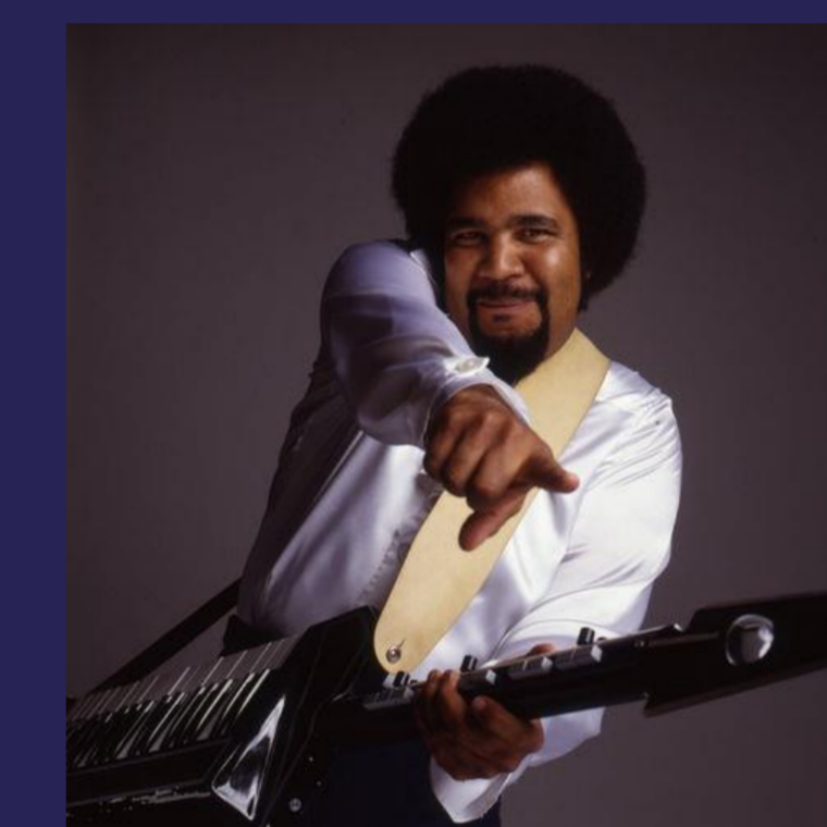
GEORGE DUKE Clavier - 276