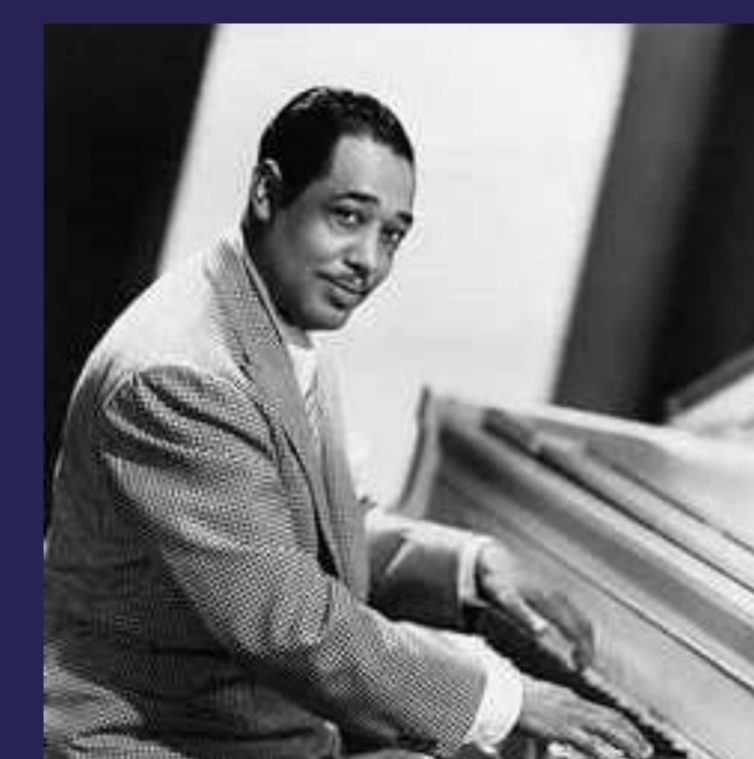
JOHNNY HODGES Piano - 154