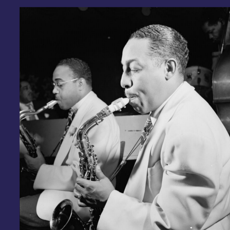
DUKE ELLINGTON Saxophone - 74