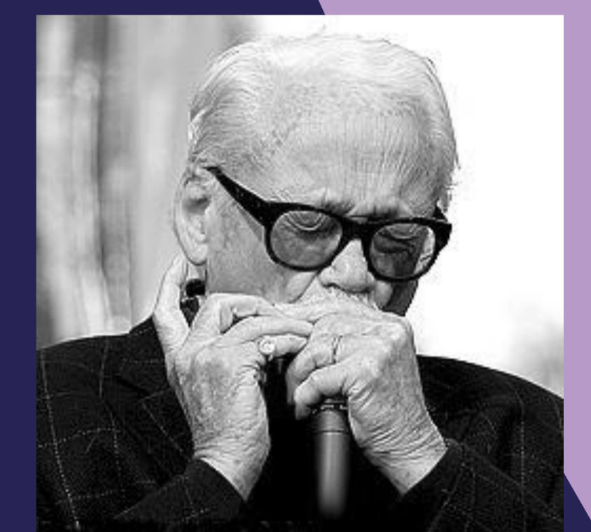
TOOTS THIELEMANS Harmonica - 220