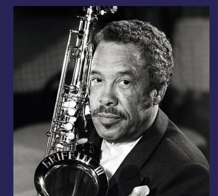
JOHNNY GRIFFIN Saxophone - 60