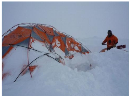
19. Un scientifique creuse pour dégager sa tente enneigée après une tempête.