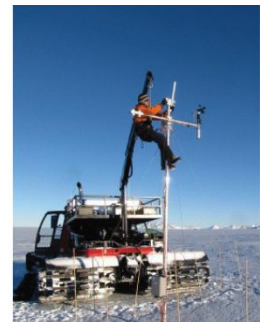
21. Installation d'une station météorologique.