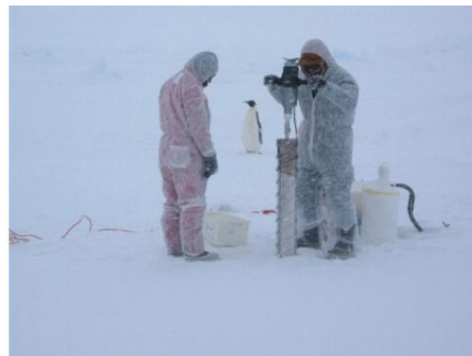
20. Les scientifiques prennent une carotte de glace.