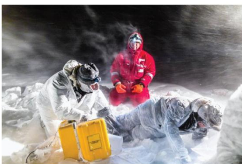
22. La récolte d'échantillons se fait parfois dans des conditions difficiles.