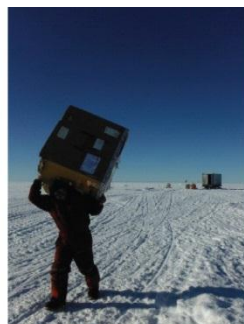
11. Le travail sur le terrain peut parfois être très physique.